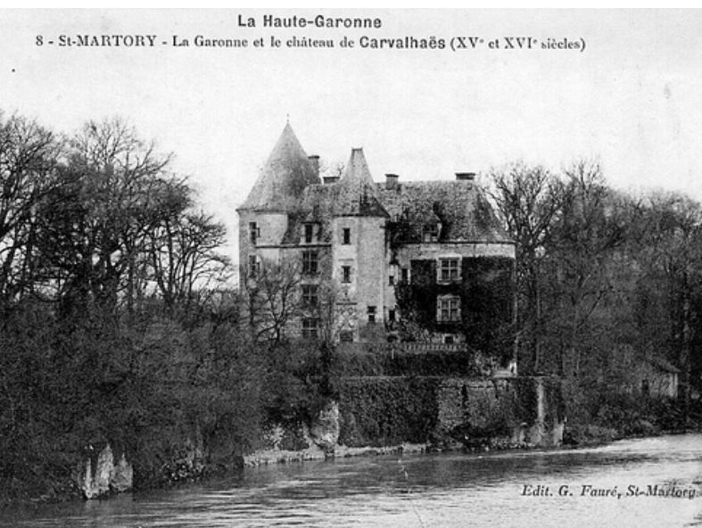
Édit. G. Fauré, St-Martory