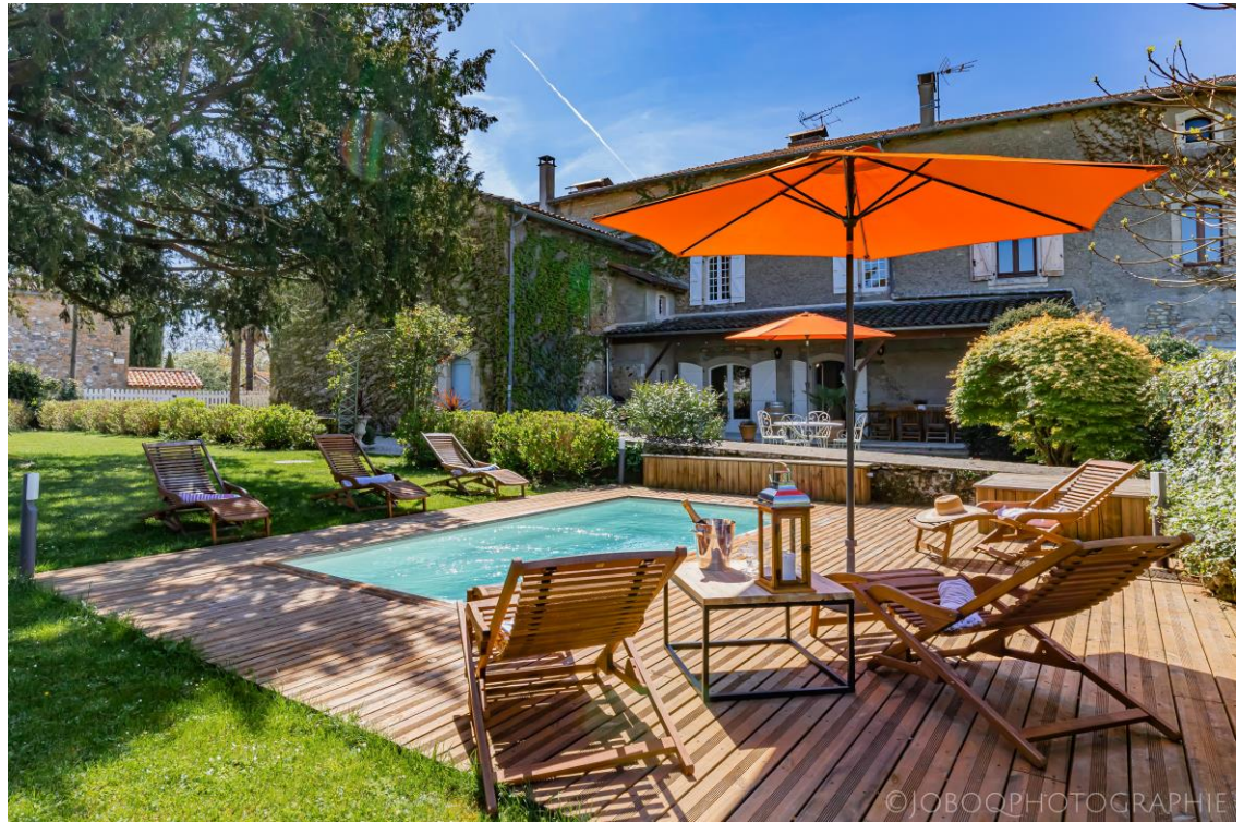
L' Ostal Cassinia